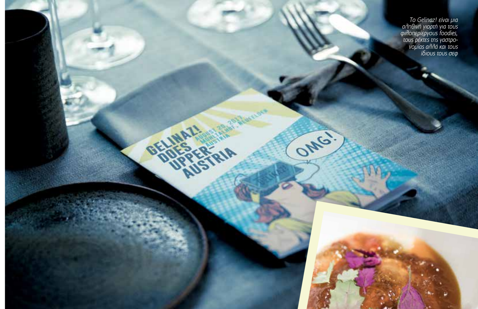
Το Gelinaz! είναι μια αθηναϊκή γιορτή για τους φιλοπερίεργους foodies, τους ρέκτες της γαστρονομίας αλλά και τους ίδιους τους σεφ